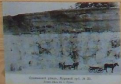
Строительство моста, Курский уезд, № 10.