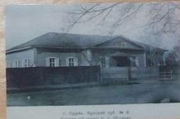
г. Суджа, Курский уезд, № 4.