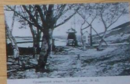
Строительство моста, Курский уезд, № 10.