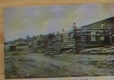
Строительство моста, Курский уезд, № 10.