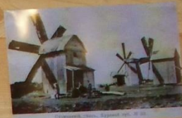
Мельница, Курский уезд, № 10.