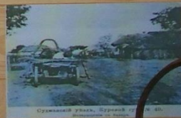
Строительство моста, Курский уезд, № 10.