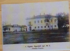
г. Суджа, Курский уезд, № 2.