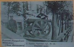
Улица Давыдовского, Курский уезд, № 10.