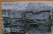
Строительство моста, Курский уезд, № 10.