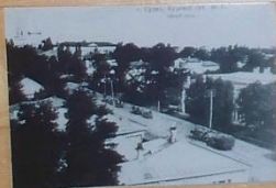
Строительство моста, Курский уезд, № 10.