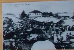
Строительство моста, Курский уезд, № 10.