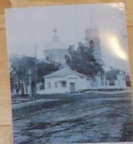
г. Суджа, Курский уезд, № 6.