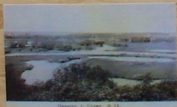
Строительство моста, Курский уезд, № 10.