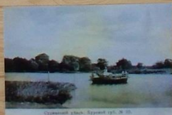
Строительство моста, Курский уезд, № 10.