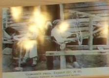
Строительство моста, Курский уезд, № 10.