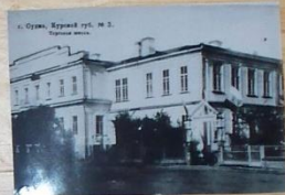
г. Суджа, Курский уезд, № 2.