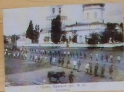
Курский уезд, Курский уезд, № 10.