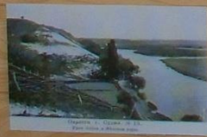
Строительство моста, Курский уезд, № 10.